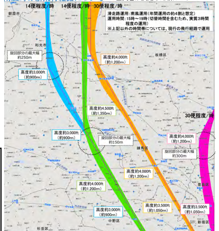
南風時の新飛行経路について 国交省が決定した新ルート 8. 練馬区

南風時A滑走路到着 南風時C滑走路到着(好天時) 南風時A滑走路到着 南風時C滑走路到着(悪天時)